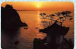
観音崎の断崖の上に建つ「千人堂」

☎ 0978-87-2111 (姫島村役場) 住 大分県国東郡姫島村 料 伊美港～姫島港 片道 大人580円、小人290円(自動車航送は別料金) 料 26台(無料・伊美港駐車場利用) URL http://www.himeshima.jp/kanko/tourist/