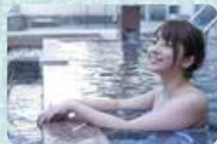
女界灘を一望できる「金印の湯」の露天風呂

博多湾の北部に位置する陸続きの島。金印「漢委奴国王」の発見場所を整備した金印公園からは博多湾を一望できます。休暇村志賀島には宿泊者以外も利用できるグラウンドゴルフ場やテニスコートなどもあり、一日中楽しめます。たっぷり遊んだ後は、温泉「金印の湯」で海を見ながらリフレッシュ!