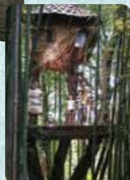
冒険に引きこまれる森のツリーハウス

大村湾～無人島～滞在記「田島」 ☎ 0959-29-5005 (株式会社大村湾リゾート・田島事務所) 住 長崎県西海市西彼町亀浦郷12-3 料 日帰り無人島プラン4,900円～ 料 40台(無料・亀浦港駐車場利用) URL https://tashima-nagasaki.com/