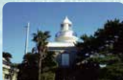
明治37年から海を見守る「姫島灯台」

国東半島沖に浮かぶ島。神話でイザナギとイザナミが生んだ島の一つ「女島」とされ、お姫様にまつわる言い伝えが「姫島七不思議」として語り継がれています。特産品を使った「姫島車えびじゃぶじゃぶ」はプリプリの歯ごたえと甘みが楽しめる自慢の一品です。