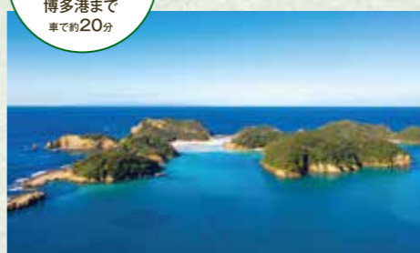
舌岐の北端の町、勝本港から船で5分の無人島「辰の島」