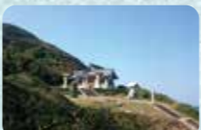
波島できない沖ノ島を拝むために設けられた「沖津宮遙拝所」