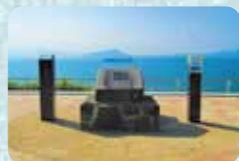
金印公園から望む博多湾

休暇村志賀島 ☎ 092-603-6631 福岡県福岡市東区勝馬1803-1 「金印の湯」立ち寄り入浴 料 大人650円、小人330円、幼児110円 時 11時～15時(最終受付14時) 毎月第3火曜 料 150台(無料) URL https://qkamura.or.jp/shikano/