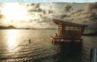
ビーチに浮かぶシーハウスから海に飛び込むと最高

全周約3.3kmの小島。森の中をターザン気分ですべり渡るジップラインや、木の上に作られたツリーハウス、海に浮かぶシーハウスなど、まさにトム・ソーヤのような生活を体験できます。海水浴、フィッシング、カヤックなどのアクティビティも豊富。