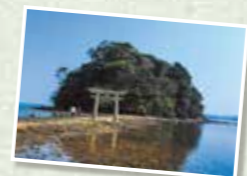
干潮時の前後、数時間だけ海から参道が現れ、歩いて参拝することができる「小島神社」

☎ 0920-47-3700 (舌岐市観光連盟) 住 長崎県舌岐市 URL http://www.kikankou.com/