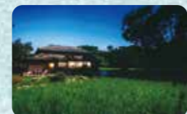
五右衛門風呂やハンモックを備えた、築70年の古民家