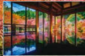
敷地内、風遊山荘の「逆さ紅葉」。見頃は11月上旬～中旬(特別観覧期間以外は要予約)