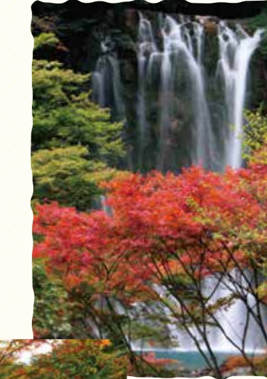
滝の周囲の木々も色づくため、滝から少し離れて見るのも一興

霧島温泉郷エリアにある滝にふさわしく、温泉水を集めて流れ落ちる珍しい「湯の滝」で、幅が16m、落差が23mあります。秋になると、豪快に立ち上るしぶきをバックに紅葉が鮮やかに浮かび上がって見え、SNS映えすると評判です。夜はライトアップも実施され幻想的な雰囲気。