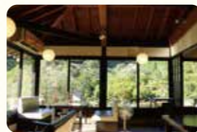
園内には蕎麦処があり、庭園を眺めながら食事ができます

1987年、耶馬溪ダム完成を記念して誕生した回遊式の日本庭園。2万㎡の広さを持つ園内には12万個にもおよぶ耶馬溪の石やダムの水を利用して滝や池が造られ、耶馬溪の渓流を再現しています。100種3万本以上の樹木が彩りを添え、特に調和の取れた造形美に映える紅葉は感動的。