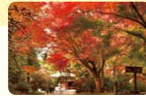
秋は境内が赤く染め上がります

☎ 0968-74-3533 〻 熊本県玉名市築地1512-77 料 大人200円、小人150円 時 9時～17時(最終受付は16時30分) 休 無休 〻 700台(無料) 〻 http://www.okunoin-ren.jp/