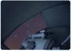
輝北天球館内部。「日本一」にふさわしく鮮やかな星空が広がります ※天体観望は完全予約制

☎ 099-485-1900 住 鹿児島県鹿屋市輝北町市成1660-3 料 バンガロー4,840円 (1名ごとに別途440円が必要。寝具付き。食事なし)ほか 輝北天球館:高校生以上520円、小中学生310円 時 チェックイン15時～、チェックアウト翌10時 輝北天球館:水・木曜・祝日10時～18時、 金～日曜10時～22時(悪天候の場合、変更あり) 休 輝北天球館:月・火曜(祝日の場合は開館、水曜休) 料 60台(無料) URL http://www.kihokuuwaba.jp/index.html