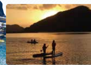
初心者でも気軽にトライできるサップやカヤック

道の駅 田野 物産販売所には地元農産物や加工品が並びます。特に特産品の干し大根を使った漬物はおすすめです。また、地元産さつまいもで作る焼芋ソフトクリームが人気を呼んでいます。 ☎ 0985-86-2960 住 宮崎県宮崎市田野町甲7885-164 時 3月～10月:9時～18時 11月～2月:9時～17時 休 1月1～3日 料 43台(無料)