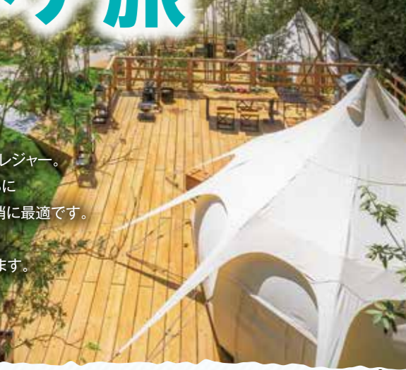
日常を忘れさせてくれる緑あふれる素晴らしいロケーション