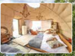
最新設備を備えながらアウトドアの雰囲気を大切にしたいテント内

コロナ禍の今、注目を集めているのがグランピングをはじめとするアウトドアレジャー。自然豊かな屋外でのびのび過ごすうちに身も心もリフレッシュでき、ストレス解消に最適です。今号では、アウトドアレジャーは不慣れという方でも楽しめる施設をご紹介します。