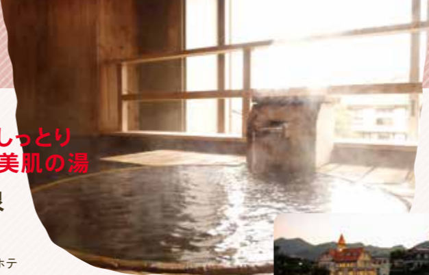
塩田川沿いに建つ公共浴場「シーボルトの湯」

☎ 0954-43-0137 (嬉野温泉観光協会) 📍 佐賀県嬉野市嬉野町 🌐 https://spa-u.net