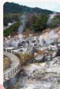
地獄を思わせる荒々しい光景の「雲仙地獄」

☎ 0957-73-3434 (雲仙温泉観光協会) 📍 長崎県雲仙市小浜町雲仙320 🕒 10時～16時 📅 悪天候の場合 📍 近くの有料駐車場を利用