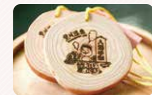
3か所の温泉を巡ることができる温泉手形

☎ 0967-44-0076 (黒川温泉観光旅館協同組合) 📍 熊本県阿蘇郡南小国町満願寺黒川 🌐 https://www.kurokawaonsen.or.jp