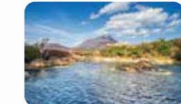
正面に見えるのは温泉街を見守る由布岳(由布院)

☎ 0977-24-2828 (別府市観光協会事務局) 📍 大分県別府市 🌐 http://www.gokuraku-jigoku-beppu.com/