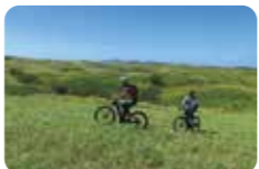
牧野をMTBで走る体験は滅多にできない

☎ 0967-35-5077 (道の駅阿蘇) 📍 熊本県阿蘇市黒川1440-1 📖 牧野トレッキング…3,800円～ 牧野ライド(2時間)7,500円～ いずれの体験も要予約