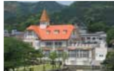
館内には食事処や地元産品のショップがある