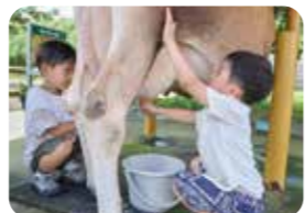
乳しぼり体験は子どもたちに大人気