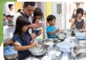
真剣な眼差しでアイスクリーム作りに挑戦

☎ 0986-33-2102 📍 宮崎県都城市吉之元町5265-103 📖 入場無料(乗馬体験や手作り体験などは有料)