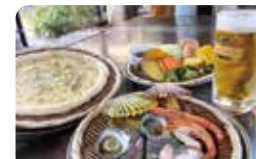
蒸すことで地元食材の旨みをそのままいただけます