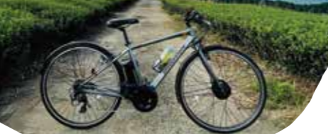
茶畑を一望しながら小休止。疲れも吹き飛びます