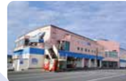
館内には食事処や地元産品のショップがある

☎ 0993-73-2311 📍 鹿児島県枕崎市松之尾町33-1 📖 カツオわら焼き体験…1,000円、食事付き2,500円～(2名から、前日までに予約) カツオ節削り体験…500円(2名から、前日までに予約)