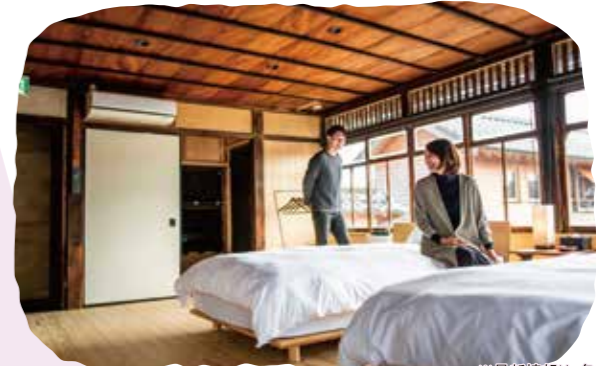
故郷に帰ってきたような安らぎに包まれます