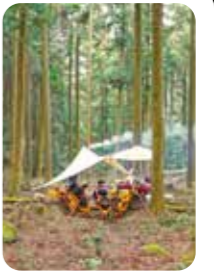
森の中で“何にもしない贅沢”が味わえます

☎0948-43-3680 (嘉麻市観光まちづくり協会) 📍福岡県嘉麻市 ※開催場所や集合場所は事前にご確認ください。