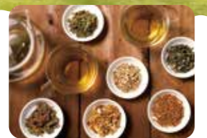
自分だけの健康茶作りは魅力的