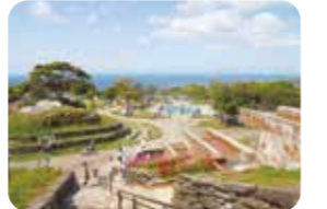
五島瀬を望む開放的な空間に癒されます