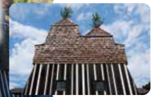
個性的な建物のショットも映えます