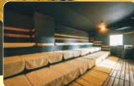
「アフグース」は12時～25時の1時間おき