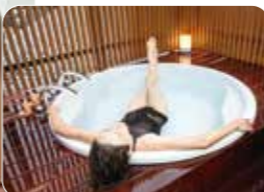
手をゆっくり伸ばせる水風呂