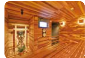
サウナストーンが配られた鳥居のあるメインサウナ室