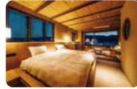
プライベート空間でサウナ三昧の滞在