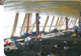
全天候型なので天気が悪くても体験できます