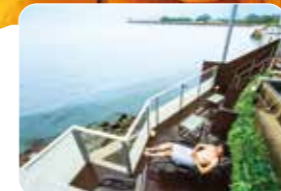
最高のロケーションに心もとろけそう