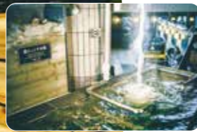
豊富な地下水を使った水風呂も

サウナブームの今、話題の施設を厳選。 汗と共に普段のストレスを流し心も潤う ウェルネスな旅に出かけましょう。