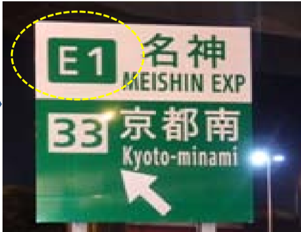
【新名神高速道路高槻JCT 投物防止柵設置】